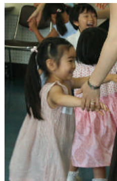
【講師研修会】の様子