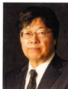
●審査委員長 梅津時比古 (桐朋学園大学 学長)

早稲田大学第一文学部西洋哲学科卒。1982.83年、ケルン音楽大学を中心にドイツの音楽教育事情を視察・研修。2004年、著書「<ゼロ弾きのゴージュ>の音楽論」で第54回(平成15年度)芸術選奨文部科学大臣賞および第19回岩手日報文学賞賢治賞を受賞。2009年、NHK制定「日本の100冊」に著書「<ゴージュ>という名前」が選ばれる。2010年、「音楽評論に新しい世界を開いた」として日本記者クラブ賞を受賞。上記のほか、主な著書に「フェルメールの楽器」「冬の旅 24の象徴の森へ」「フェルメールの音」「音と言葉のソナタ」「耳のなかの地図」「日差しの中のバッハ」「非日常と日常の音楽」「音をはこぶ風」など。音楽評論活動のほか、CD、コンサートのプロデュース、内外のコンクール審査員も務める。早稲田大学講師。公益財団法人三井住友火災海上文化財団理事。公益財団法人ジェスク音楽文化振興会理事。公益財団法人福田靖子賞基金理事。公益財団法人アフィニス文化財団専門委員。横浜みなとみらいホール専門委員。横須賀芸術劇場推薦委員など。